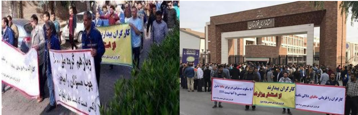
۱۰ کارگر فولاد اهواز به اداره اطلاعات احضار شدند:

کارگران فولاد اهواز ؛ قدمی به عقب باز نخواهیم گشت: