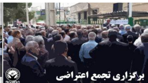
تجمع اعتراضی پرستاران بیمارستان بابل